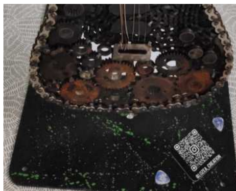
Catégorie objet lycée – LYC Diderot – Romilly – BODNAR Manon (terminale)