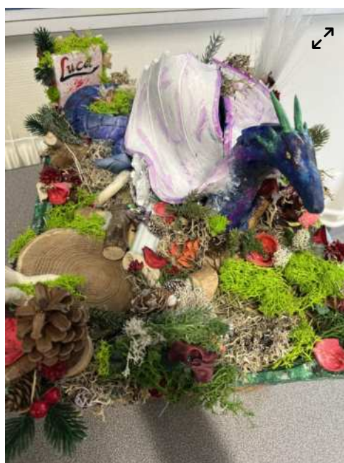
Coup de coeur collège – CLG Pierre Labonde – Méry-sur-Seine – AMODRU Leslie