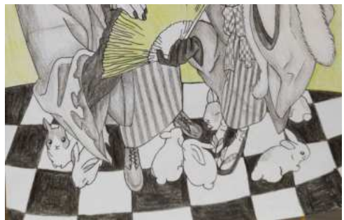
Catégorie dessin 6° 5° – CLG Belgrand – Ervy – MEIGNE Abbygaëlle – 5e