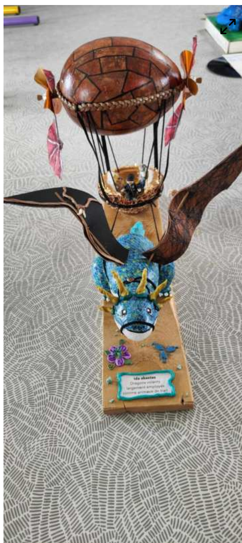
Catégorie objets 6° 5° – CLG Othe et Vanne – Aix Villemaur Pâlis – LECONTE-GOUJON Eiléanor