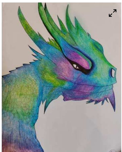
Catégorie dessin 6° 5° – CLG Charles Delaunay – Lusigny-sur- Barse – DUTITRE Cloé